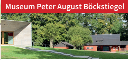
Museum Peter August Böckstiegel Modernes Museum und historisches Wohnatelier des bedeutenden Vertreters des westfälischen Expressionismus.