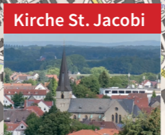
Kirche St. Jacobi Ältestes Gebäude der Stadt mit Kirchturm aus dem 12. Jh.