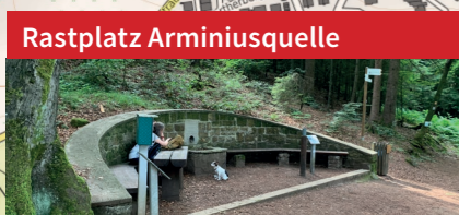
Rastplatz Arminiusquelle Stimmungsvoller Rastplatz im Wald, auf dem der Geruchssinn thematisiert wird. Früher sprudelte hier die Arminiusquelle.