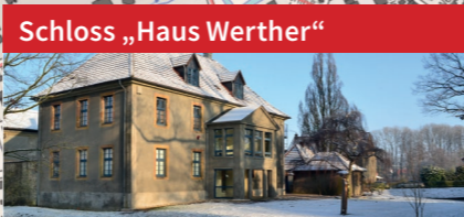
Schloss „Haus Werther“ Altes Rittergut (14. Jh.) – heute befinden sich hier das Bürgerbegegnungszentrum, die Stadtbücherei sowie das Trauzimmer.