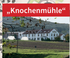
„Knochenmühle“ Industriedenkmal einer ehemaligen Knochenleimfabrik (ca. 1825).