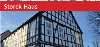
Storck-Haus Die Anfänge des Süßwarenwaren-Konzerns Storck („Werther's Original“) liegen in diesem Fachwerkhaus von 1760 begründet.