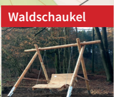
Waldschaukel Einfach entspannen und den weiten Blick ins Tal genießen.