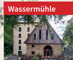
Wassermühle Wassermühle von 1535 in Deppendorf (Bl) mit Gastronomie.