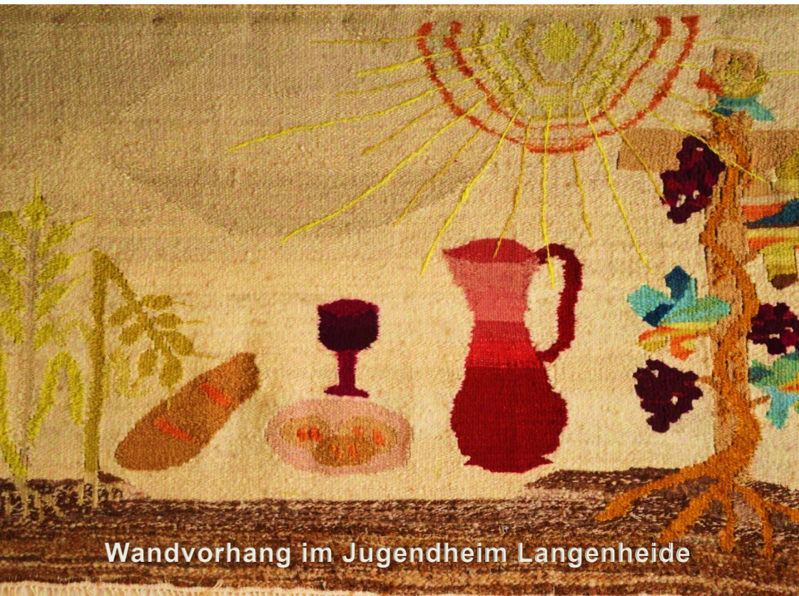
Wandvorhang im Jugendheim Langenheide