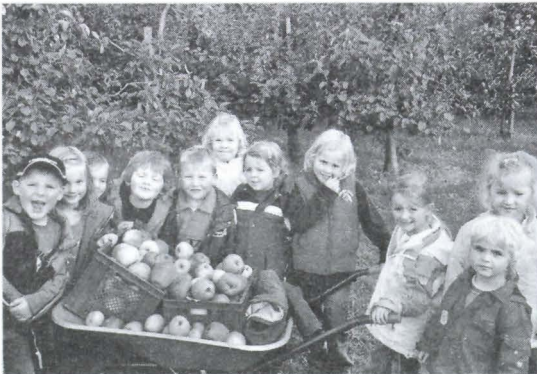
Da staunen die Kinder: sooo viele Äpfel

Das Wetter meinte es mehr als gut mit uns, wir wanderten mit den Kindern in Richtung Apfelplantage. Dort wurden wir bereits von Frau Linhorst erwartet. Zur Begrüßung durfte jeder schon mal ein Apfelstück verspeisen. Die Äpfel waren lecker und fruchtig nach unserer Wanderung. Die Kinder langten auch ordentlich zu.