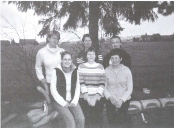
Das Mitarbeiterteam des Kindergartens Oststraße

Als evangelische Einrichtung ist die christliche Erziehung ein wesentlicher Schwerpunkt unserer Einrichtung. Glauben lebt von der Zuwendung Gottes. Die Fragen nach Lebenssinn und Werten kommen von den Kindern selbst. Im Miteinander spüren wir ihnen nach.