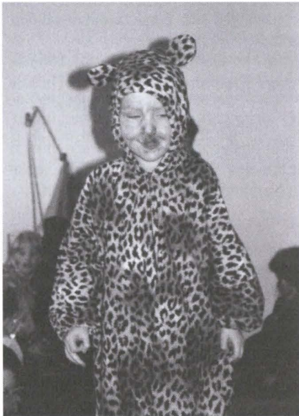
Hier sehen wir einen gefährlichen Leoparden

Auch die Eltern werden aktiv, wenn es am Mittwoch den 22.02. heißt: Karnevalsdekoabend im Sonnenland.