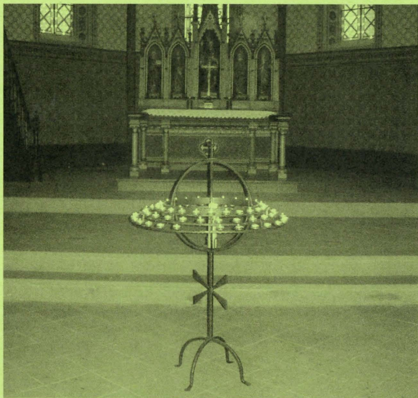
Licht der Welt