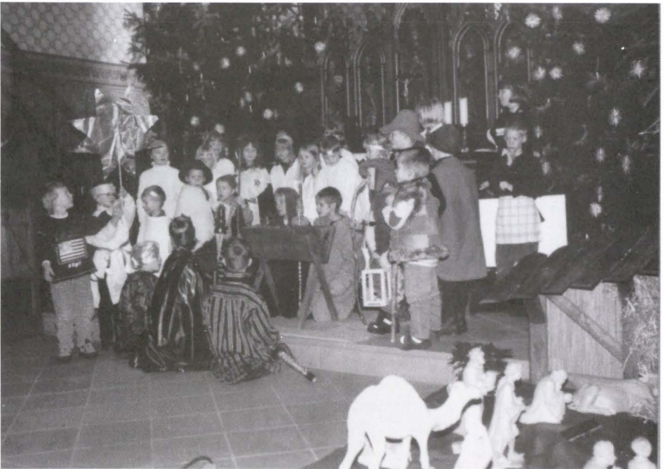
Krippenspiel in St. Jacobi