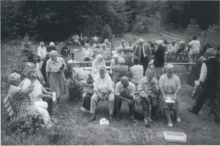
Im Freien schmeckt es noch mal so gut

Himmelfahrt im Grünen! Ein sehr gut vorbereiteter Tag, zu dem auch der Himmel seinen reichlichen Sonnenschein schenkte.