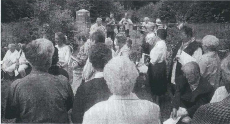
Beim Gottesdienst - mit tatkräftiger Unterstützung des Posaunenchores

Der Platz war, mit Bänken und Stühlen und einem Altar versehen, gut vorbereitet. Den Gottesdienst hielt der Ortspfarrer Pokoj.