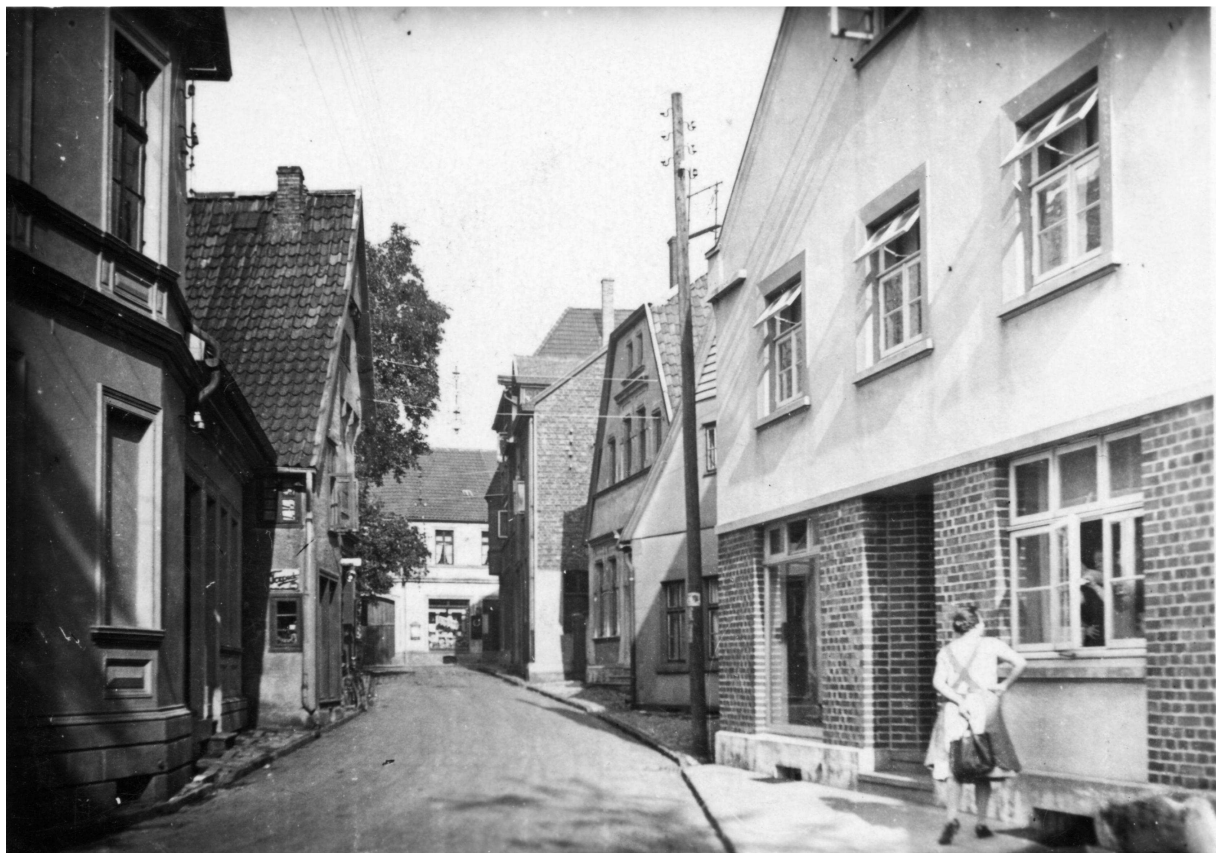
Rosenstraße 9 (Foto um 1930)