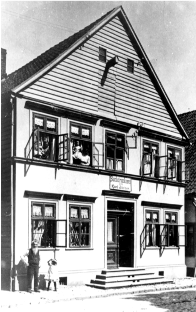
Ravensberger Str. 41

1844 - 1925 Werther Nr. 8a 1925 - 1985 Ravensberger Str. 53