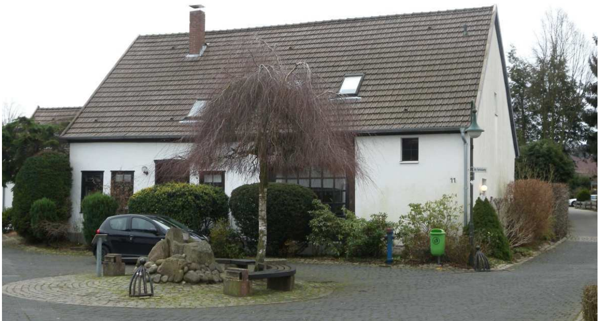
Im Viertel 11