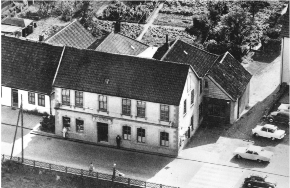
Alte Bielefelder Straße 24 (Ansichtskarte um 1960)

Werther Nr.74 (1768-1925) Bielefelder Str. 24 (1925-1985)