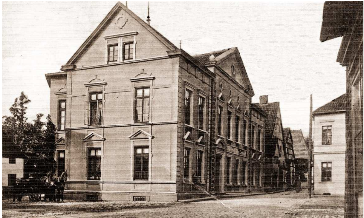
Ravensberger Str. 10, Hotel Eickhoff